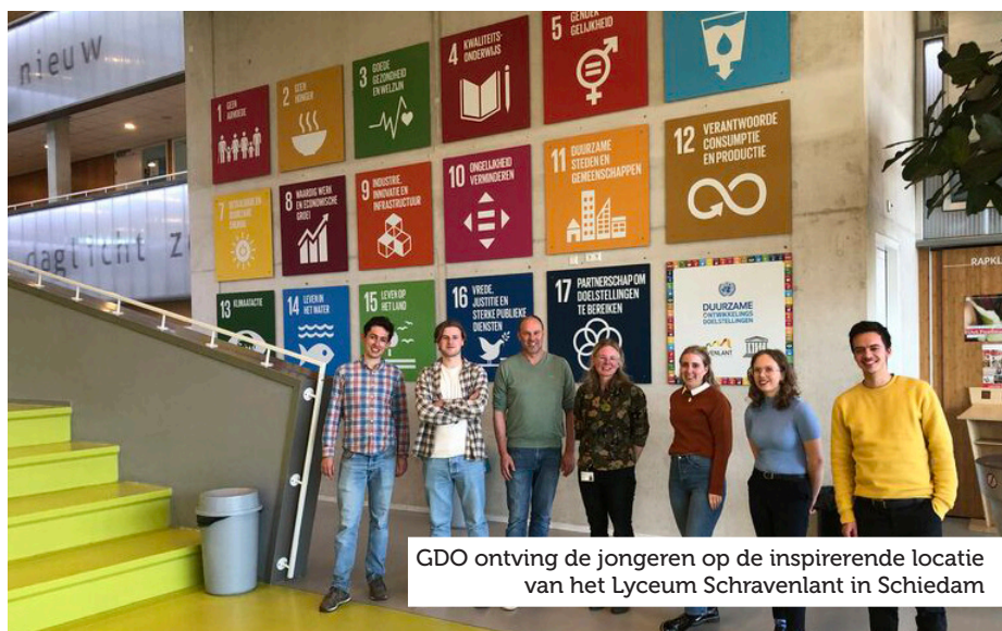
GDO ontving de jongeren op de inspirerende locatie van het Lyceum Schravenlant in Schiedam

Het WUR-project leidt tot een leerdocument met inzicht in de succesfactoren om daarmee andere lokale centra te inspireren om te verbreden en de daarbij nodige stappen te zetten. Deelnemende centra zijn NMCX in Haarlemmermeer, De Groene Belevens in Leusden, Duurzaamheidscentrum Assen, De Ulebelt in Deventer en CNME Maastricht. Dit onderzoek wordt financieel ondersteund door de stichting Van Dijk Nijkamp.